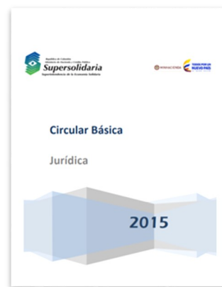
Circular Básica Jurídica