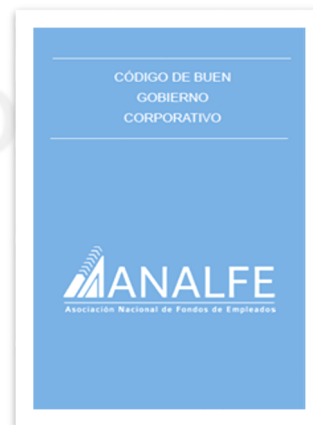
Guía de buen Gobierno Corporativo ANALFE