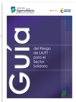
Guía del Riesgo de LA/FT para el Sector Solidario