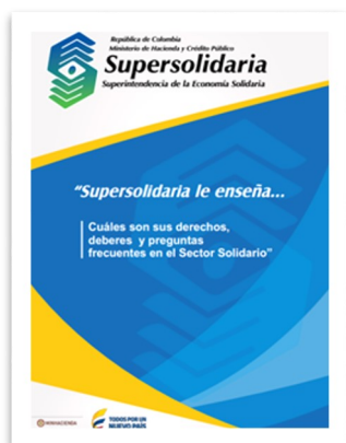
Cartilla "Supersolidaria le enseña..."