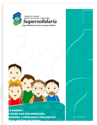
Cartilla Derechos y Deberes Sector Solidario