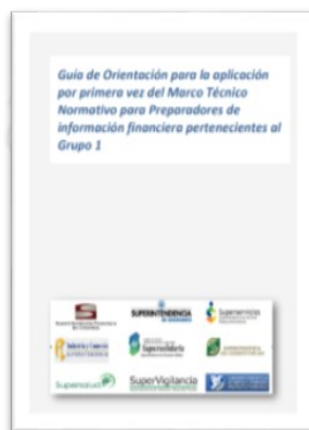
Guía de orientación en la aplicación de las NIF