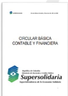
Circular Básica Contable y Financiera