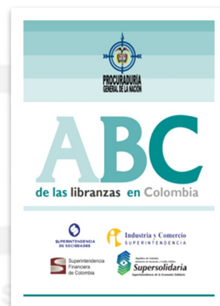
ABC de las Libranzas en Colombia